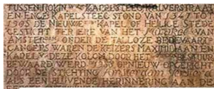
Památní deska popisující zázrak