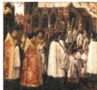
Starobylý obraz zobrazující slavnostní procesí k uctění zázraku