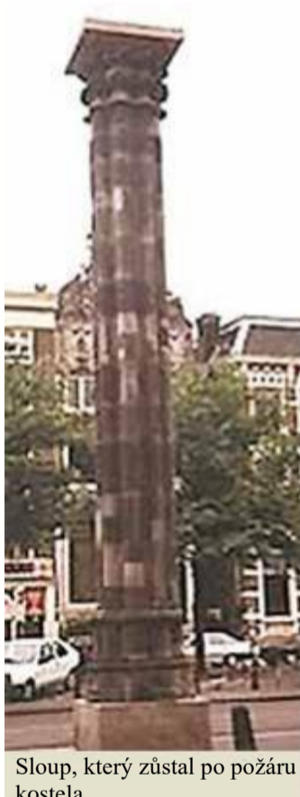
Sloup, který zůstal po požáru kostela