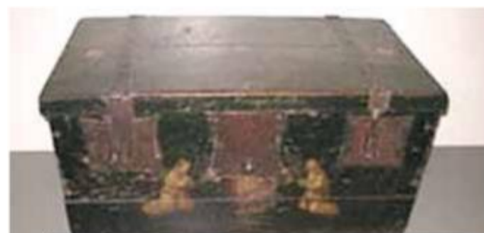
Skříňka, ve které byla uchovávána zázračná hostie.