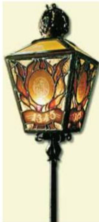
Lampa, na které je ukázán Nejsvětější svátost, připomíná první procesí „Stille Omgang“, která se koná k uctění zázraku.