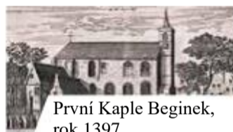
První Kaple Beginek, rok 1397