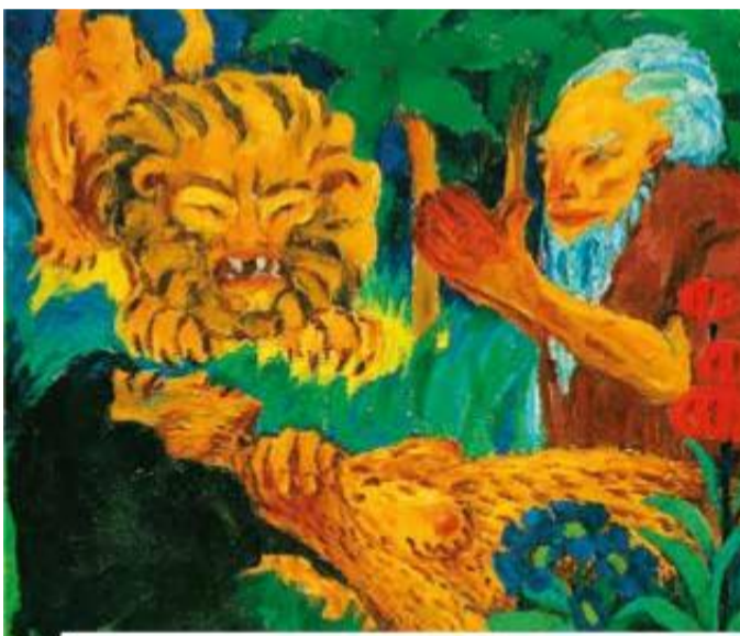
Emile Nolde „Smrt na poušti“