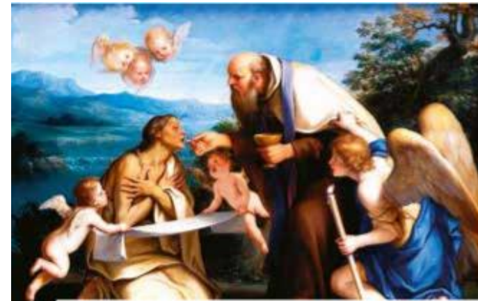
Marcantonio Franceschini „Poslední přijímání sv. Marie Egypt'anky“ /1690/