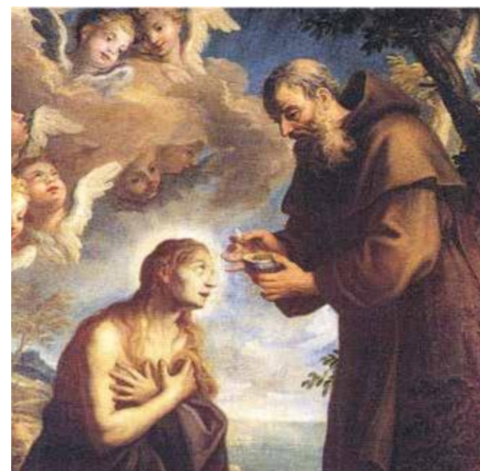
„Svatá Marie Egypt'anka,.. Kolekce diecézního muzea v Miláně.

S vatá Marie Egypt'anka opustila ve věku 12 let své rodiče a odebrala se do Alexandrie, kde 17 let vedla prostopášný život až do dne, kdy se rozhodla připojit se k poutníkům jdoucím do Jeruzaléma na svátek Povýšení svatého kříže. Po příchodu do Jeruzaléma ji na prahu chrámu zadržela nevysvětlitelná síla. Vyděšeně pohlédla na obraz sv. Marie Panny a pochopila celý svůj dosavadní život. Začala velmi litovat svých hříchů. Poté mohla vstoupit do kostela a uctívat svatý kříž. Nebyla ve svatyni příliš dlouho. „Přeješ-li řeku Jordán, nalezněš pokoj“ - tato slova uslyšela od Panny Marie, a tak následující den po sv. zpovědi a sv. přijímání Marie Egypt'anka překročila řeku, za kterou se prostírala Arabská poušť. Zde samotně prožila 47 let, kdy nepotkala ani zvíře