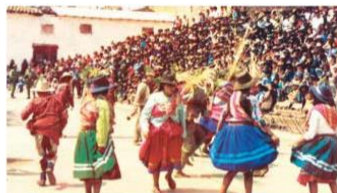
Oslavy Divino Niño