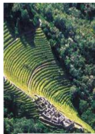
Zaoblené terasy, Peru