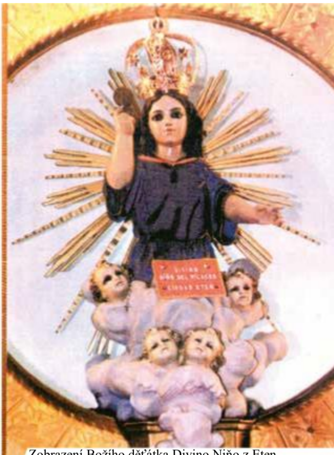
Zobrazení Božího děťátka Divino Niño z Eten