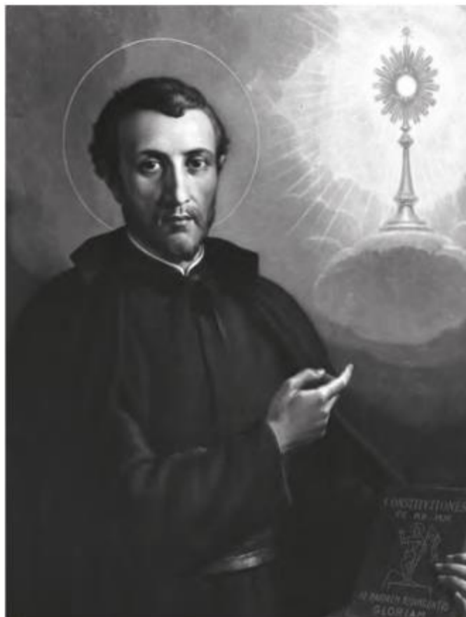
Svatý František ustanovil zbožnou praxi neustálé adorace Nejsvětější Svátosti.