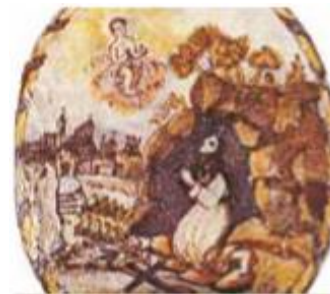
Anežka v jeskyni, ve které žila jako poustevnice

Anežka strávila celý svůj život jako poustevnice a kajícnice v jeskyni nazvané El Rodeno, která je dodnes poutním místem