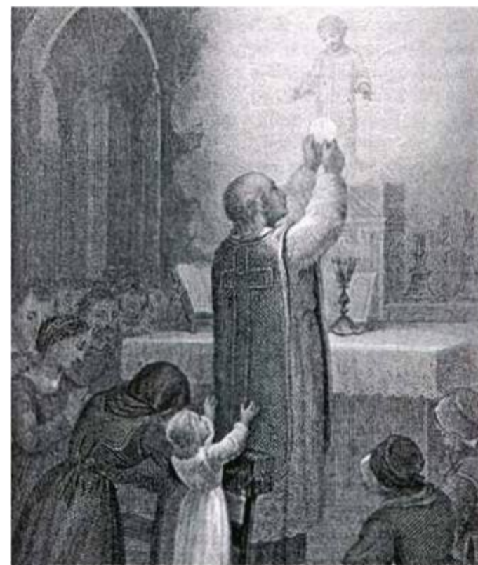
Starobylý obraz zobrazující zázrak

K e konci XIV. století francouzští kardinálové zvolili anti-papeže, protože chtěli papežské sídlo znovu přenést do Avinonu. To způsobilo velký zmatek v církevním prostředí. Někteří kněží dokonce pochybovali, zda mají platná a náležitá svěcení. V době eucharistického zázraku se ve městě Moncada / orig. Inés de Moncala/. ukázalo Anežce v posvěcené hostii děťátko Ježíš. Anežka byla tehdy dítětem, ale později se stala mystičkou a byla prohlášena za svatou. Zjevení děťátka Ježíš se opakovalo v následujících mších svatých a viděla je pouze Anežka, která dokázala rozlišit konsekrovanou hostii od nekonekrované i tehdy, kdy kněz provedl zkoušku po celebraci mše. Tento zázrak rozptýlil pochybnosti kněze, který si nebyl jistý svým svěcením, protože biskup,