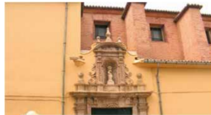
Kostel, ve kterém se zázrak stal