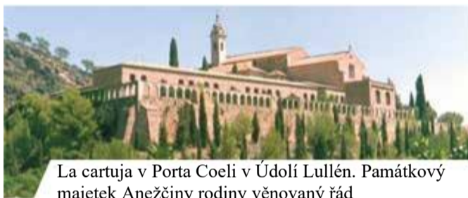
La cartuja v Porta Coeli v Údolí Lullén. Památkový majetek Anežčiny rodiny věnovaný řád