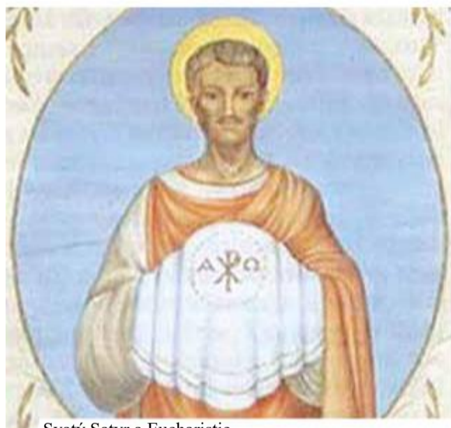
Svatý Satyr a Eucharistie.