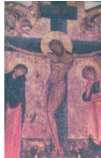
Zázračný obraz, na kterém se oživila Kristova postava a potvrdila sv. Tomáši správnost jeho díla.