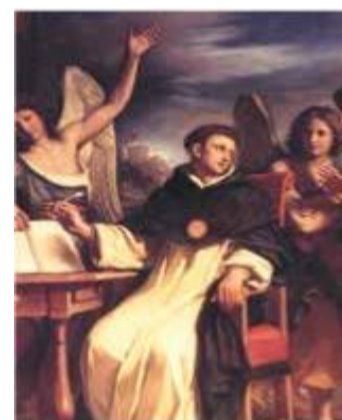
G. Francesco Barbieri, zvaný Guercino, sv. Tomáš z Akvinu píše v přítomnosti andělů /1662